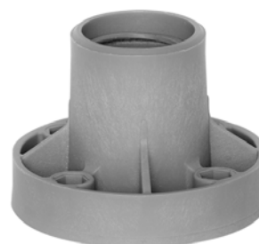
spodná časť ISP160-M10 (ISP200-M10)