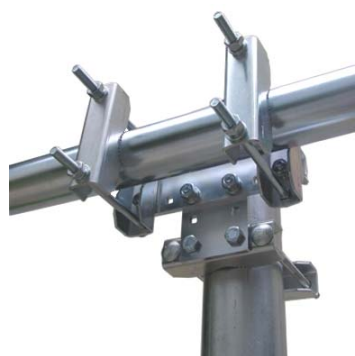
STR9 + TPM1500 + STM1500